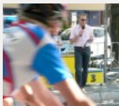
Rund 250 Sportler nahmen an dem traditionellen...