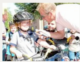
Die Organisatoren legen auch Wert auf Wettkämpfe für Kinder und Jugendliche, denn dies sind „die Profis von morgen“.

Münster-Hiltrup - Um 21.19 Uhr setzte der Sieger des Elite-Rennens „66x rund um die Marktallee“ am Samstag vor Hunderten Schaulustigen zum Schlussspurt über die Ziellinie vor der Hiltruper Buchhandlung an. Die jüngste Auflage des seit 1987 vom hiesigen Wirtschaftsverbund und seit zwei Jahren federführend vom Kooperationspartner, dem Radsportverein (RSV) Münster von 1895, organisierten Spektakels war damit Geschichte. Nicht erst zu diesem Zeitpunkt beschäftigte die Frage: Wie