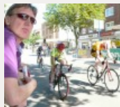
Rund 250 Sportler nahmen an dem traditionellen...

Zudem sind sowohl die Bodelschwingstraße als auch die Kardinalstraße,