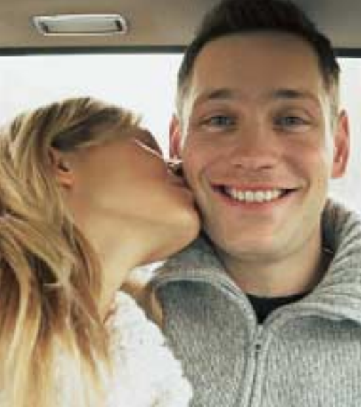
Happyend nicht ausgeschlossen.

klauseln sowie Klauseln, die pauschale oder unzumutbare Änderungen des Services vorsehen. Bei immerhin sieben Anbietern fanden wir deutliche Verstöße gegen das AGB-Recht.